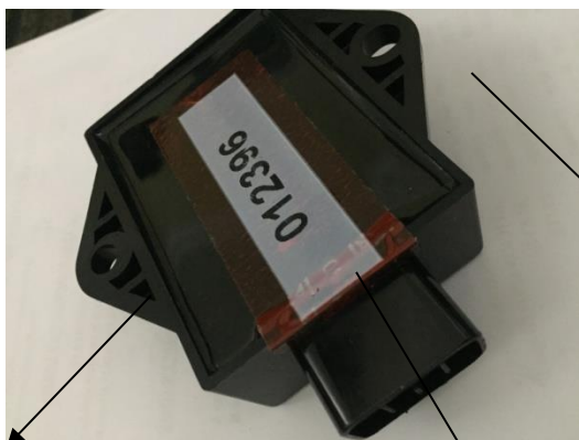
(1*) QUE NO ESTE ROTO

Aquellos pilotos que no se presenten al sorteo o presenten una centralita que no se adecue a lo estipulado por lo que hace a estado de funcionamiento, limpieza y anclajes en perfecto estado, NO podrán tomar parte ni en el sorteo ni en los entrenamientos ni carreras