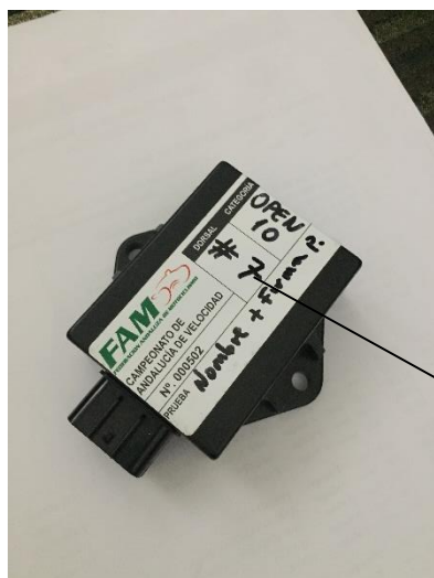
(1*) PRECINTADO CENTRALITA