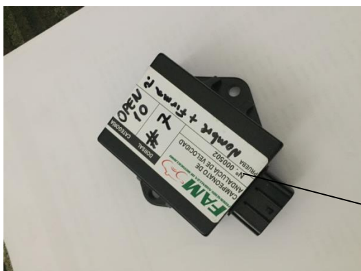
(2*) PRECINTADO CENTRALITA